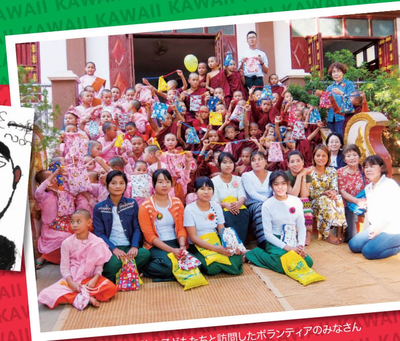
シェグニ孤児院の子どもたちと訪問したボランティアのみなさん